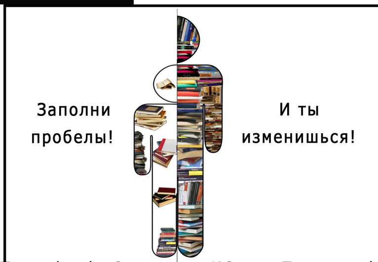
Иллюстрация: Карина Идрисова. Копирование и распространение без разрешения автора запрещено.